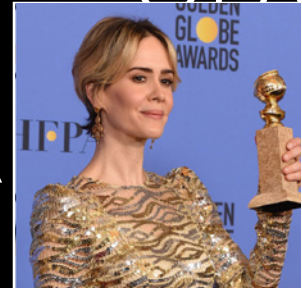
RÉALISÉ AVEC OLAPLEX, SARAH PAULSON