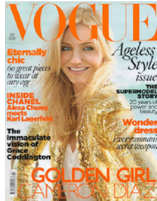
RÉALISÉ AVEC OLAPLEX, CAMERON DIAZ