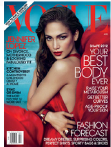
RÉALISÉ AVEC OLAPLEX, JENNIFER LOPEZ