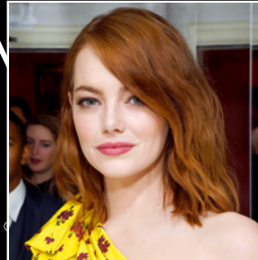
RÉALISÉ AVEC OLAPLEX, EMMA STONE